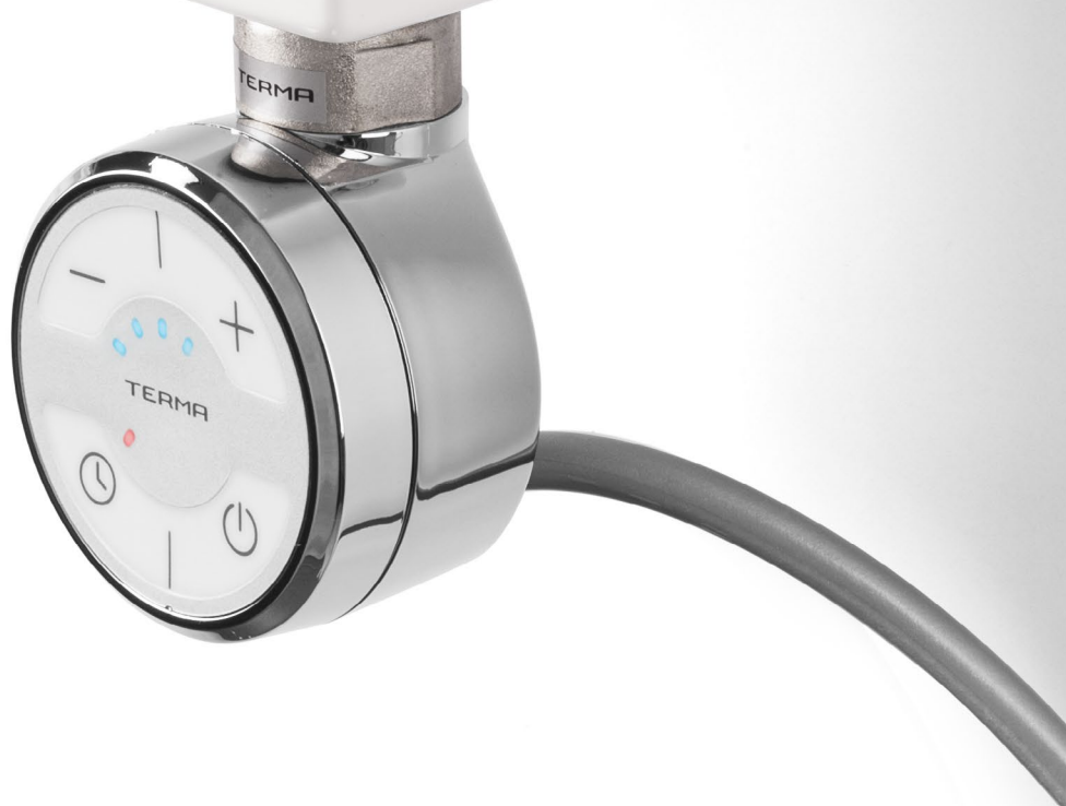
fot. kolor: chrom; kabel: prosty